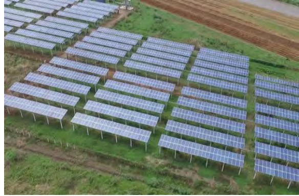
โครงการซีอาร์ โซลาร์ (บางบัวทอง)