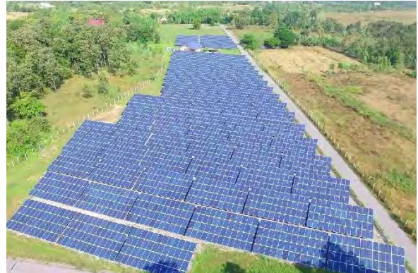
โครงการวังการคำรุ่งโรจน์ (ขอนแก่น)