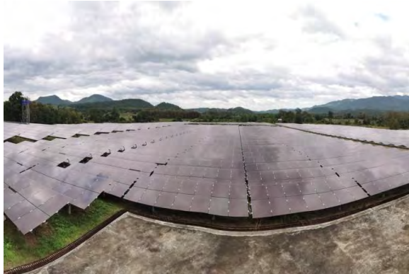
โครงการแม่สะเรียง โซลา (แม่ฮ่องสอน)