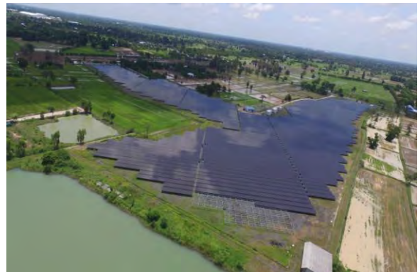
โครงการเจพี โซลาร์ (สุรินทร์)