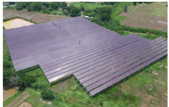
โครงการสมภูมิโซลาร์ (หนองคาย)