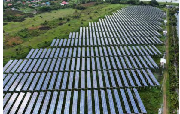
โครงการสแกน อินเตอร์ พาร์อีสท์ (หนองจอก)