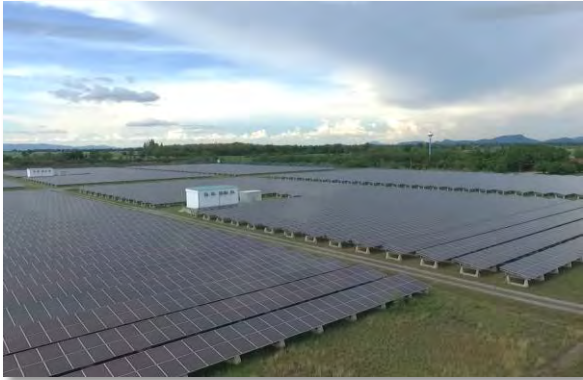
โครงการสแกน อินเตอร์ พาร์อีสท์ (ลพบุรี)