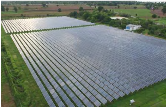
โครงการ IS (นครราชสีมา)