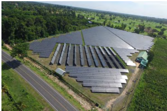
โครงการ UP (ศรีสะเกษ)