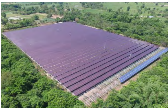
โครงการสมประสงค์ฯ (อุดรธานี)