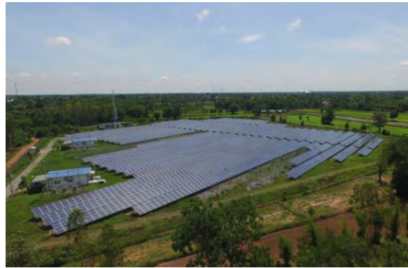
โครงการชันพาร์ค 2 (กาฬสินธุ์)