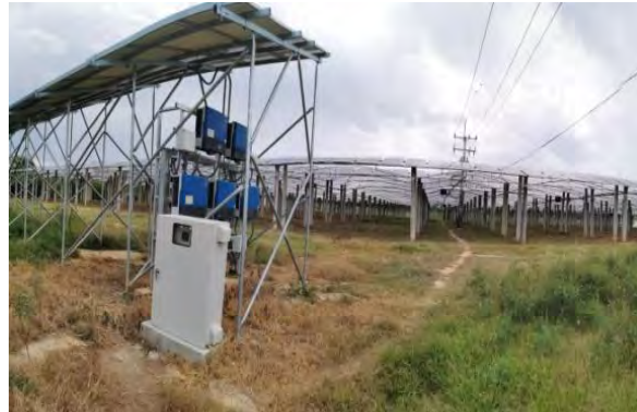
โครงการ GE (ประจวบคีรีขันธ์)