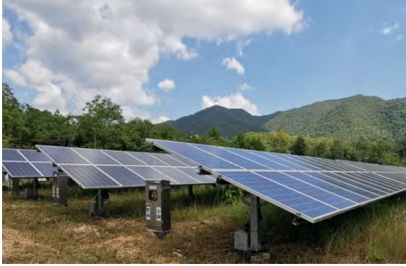
โครงการซีอาร์ โซลาร์ (ลำปาง)