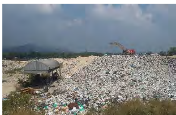
โครงการคลีนซิตี (ชลบุรี)