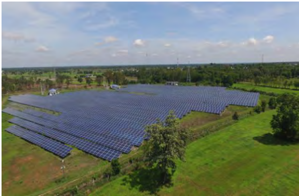
โครงการชันพาร์ค (กาฬสินธุ์)