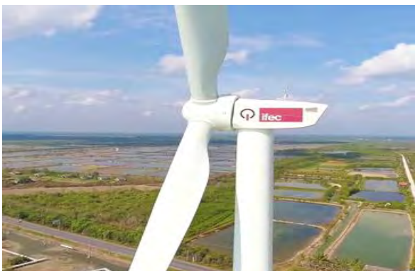
โครงการพลังงานลม iwind